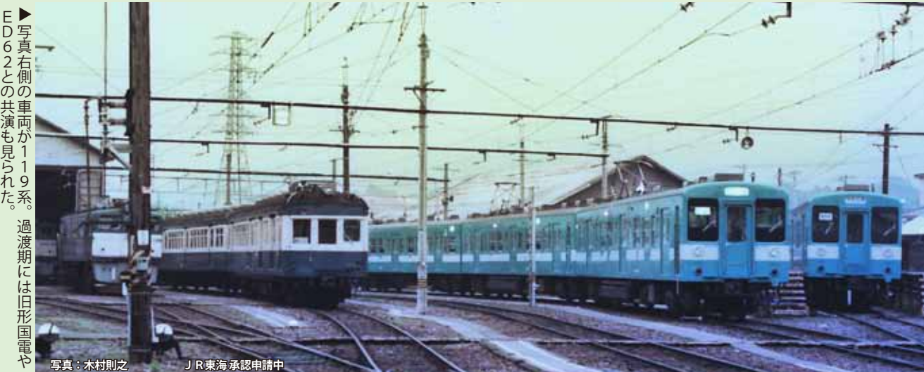
▶写真右側の車両が119系。過渡期には旧形国電やED62との共演も見られた。

6月発売予定 N 119系 飯田線 10-1486 2両セット 予価 ¥8,800+税 10-1487 3両セット 予価 ¥13,600+税