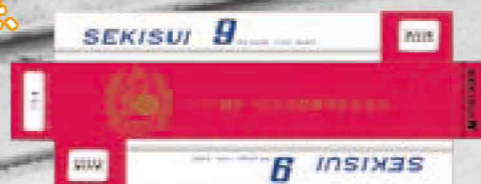
*50年前のパッケージイメージで復刻