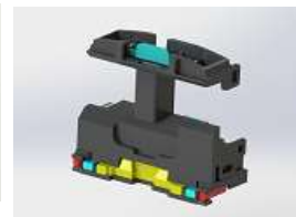
ライトケース・ライトレンズの3Dイメージ